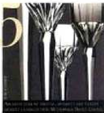
PHOTO: PIERRE-LOUIS PIRELLI/GETTY IMAGES STYLING: PIERRE-LOUIS PIRELLI/GETTY IMAGES