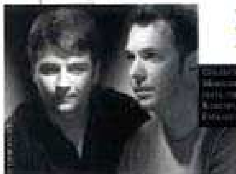
PHOTO: PIERRE-LOUIS PIRELLI/GETTY IMAGES STYLING: PIERRE-LOUIS PIRELLI/GETTY IMAGES