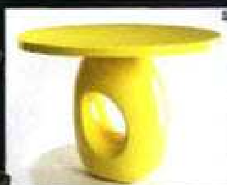
PHOTO: PIERRE-LOUIS PIRELLI/GETTY IMAGES STYLING: PIERRE-LOUIS PIRELLI/GETTY IMAGES